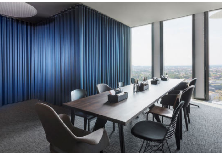
Design Offices diverse Standorte