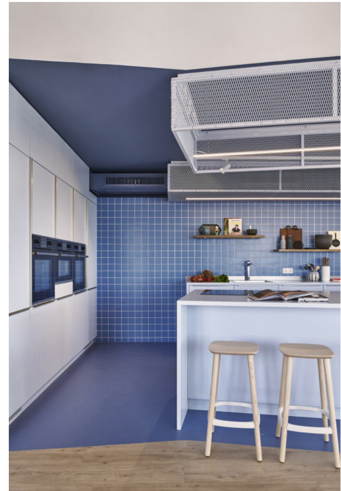
HVNS Hamburg | 2021