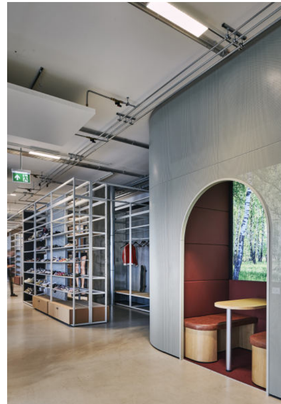
Birkenstock H11 Köln | 2021