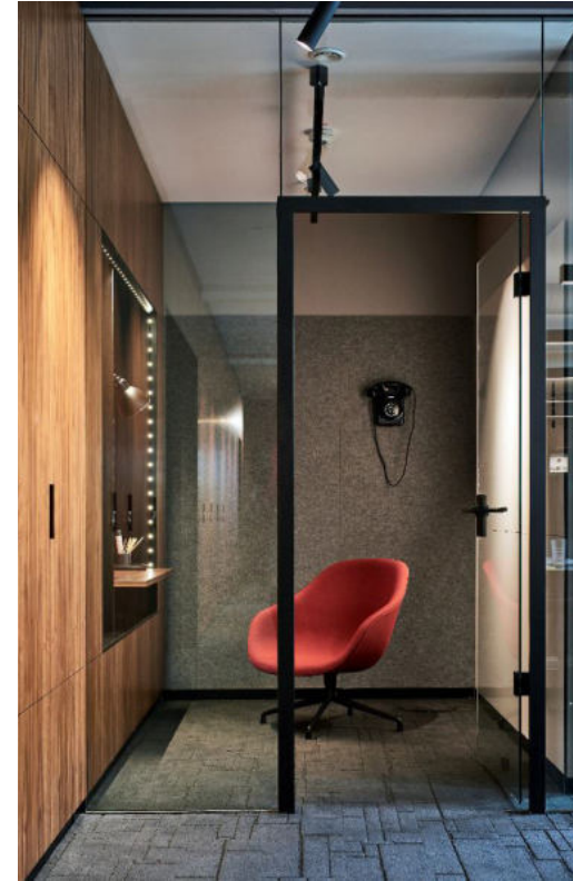
Deutsche Wohnwerte Heidelberg | 2018