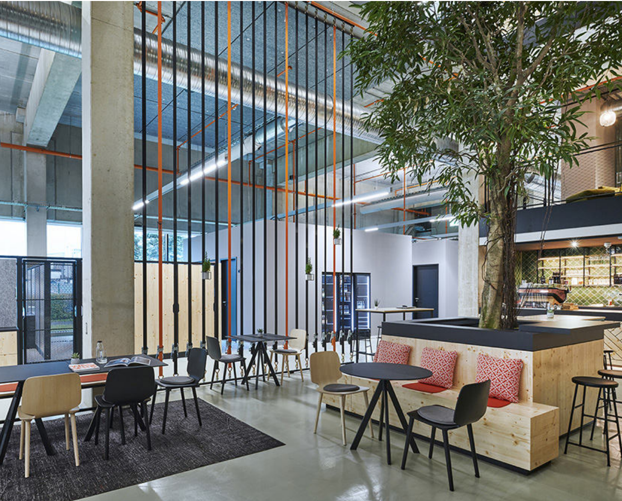
List Gruppe Nordhorn & Bielefeld | 2021