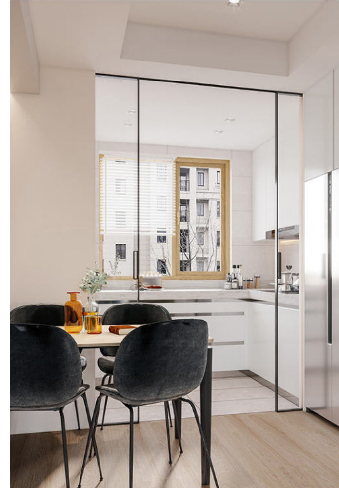
APARTMENTS CHANGCHUN/CHINA Changchun/China | Fertigstellung Ende 2021