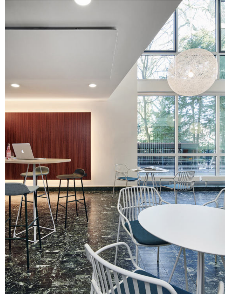
MAX PLANCK INSTITUT Hamburg | 2020