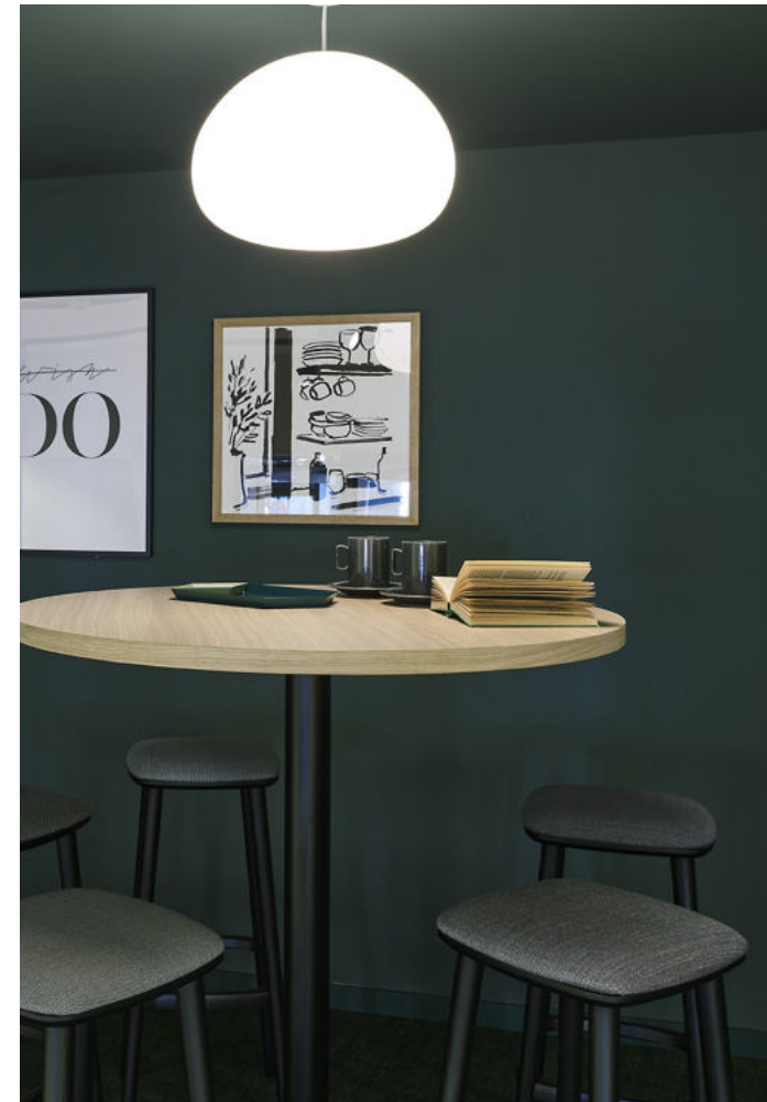
HVNS Hamburg | 2021