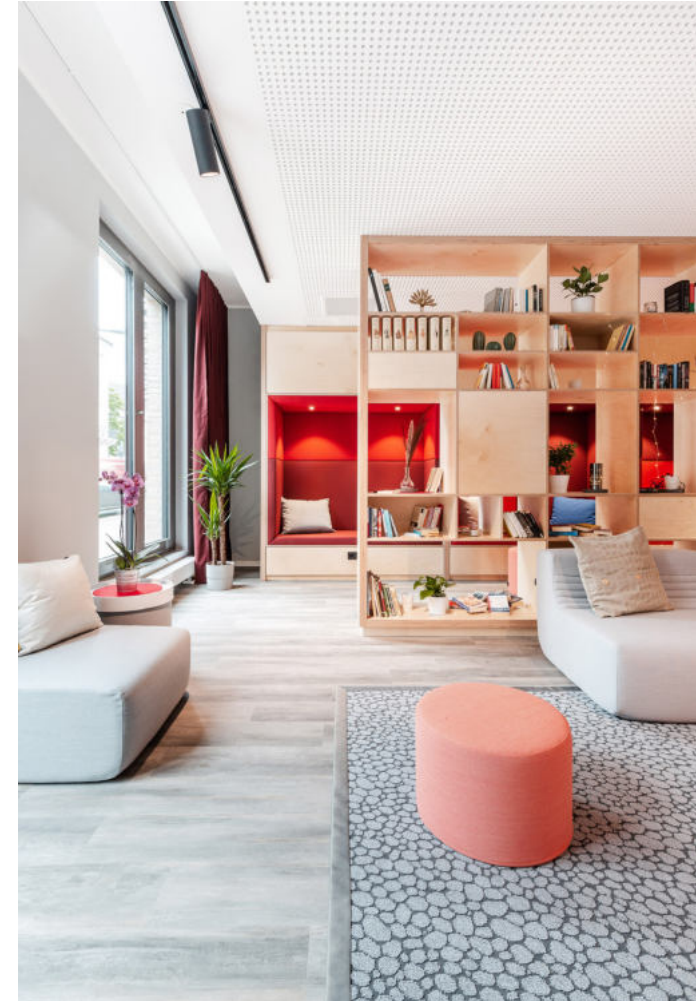
THE FIZZ Freiburg | 2021