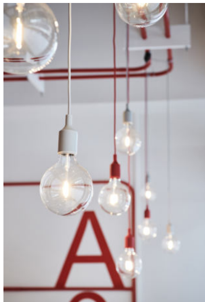
BLUTSPENDERAUM Hamburg | 2018