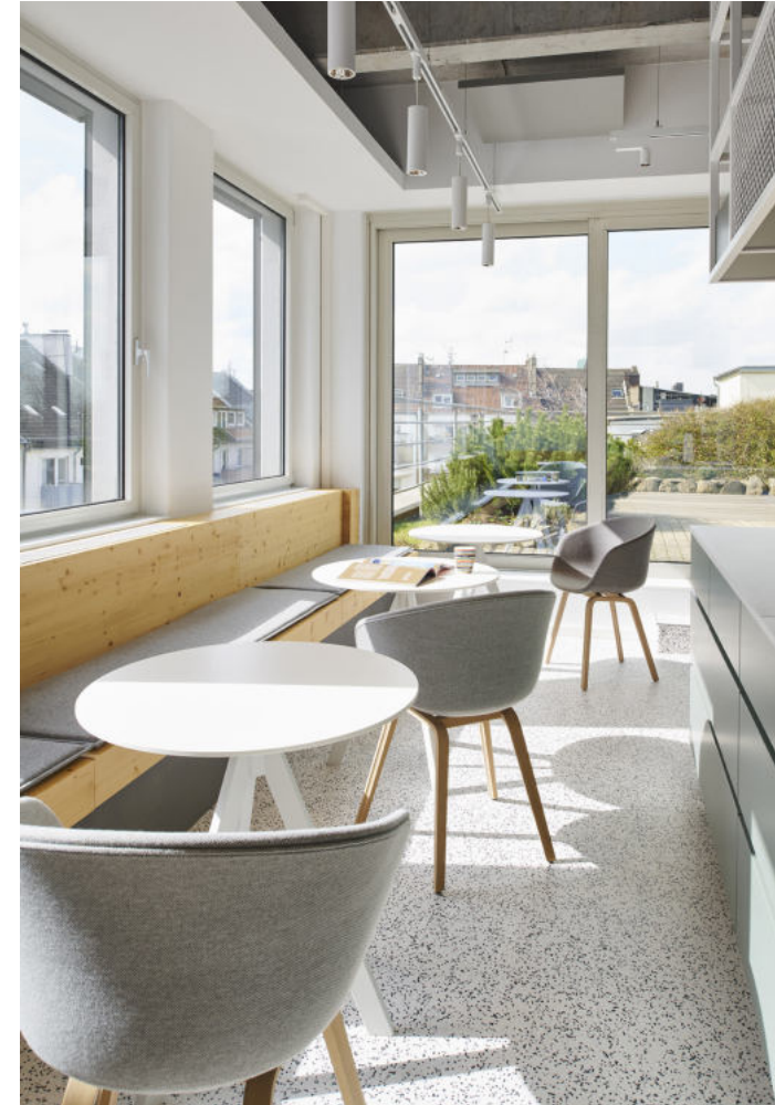
TWT Digital Group GmbH Düsseldorf | 2020