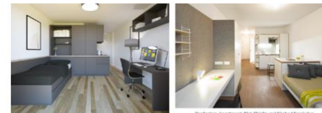
Business-Apartment Bild Objekt und Küche Microwing

Die Konzeption und Planung müssen das rechtzeitig berücksichtigen, um so frühzeitig Kosten zu sparen. Dadurch, dass die gemeinsame bedarfs- und budgetgerechte Beratung und Planung im Fokus unserer Arbeit steht, werden Ressourcen frei für hochwertige Qualität. Denn Wohnatmosphäre entsteht durch eine wertige und praktische Einrichtung. Und wenn die stimmt, dann werden die Bewohner möglichst während der gesamten Zeit des Aufenthalts in einer neuen Stadt an das Objekt gebunden. Somit profitieren alle Kunden von der gebündelten und zielgerichteten Kompetenz aus beiden Bereichen.